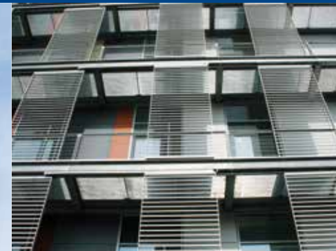
Schiebeläden am BKA Wiesbaden, die dem Lauf der Sonne automatisch folgen.