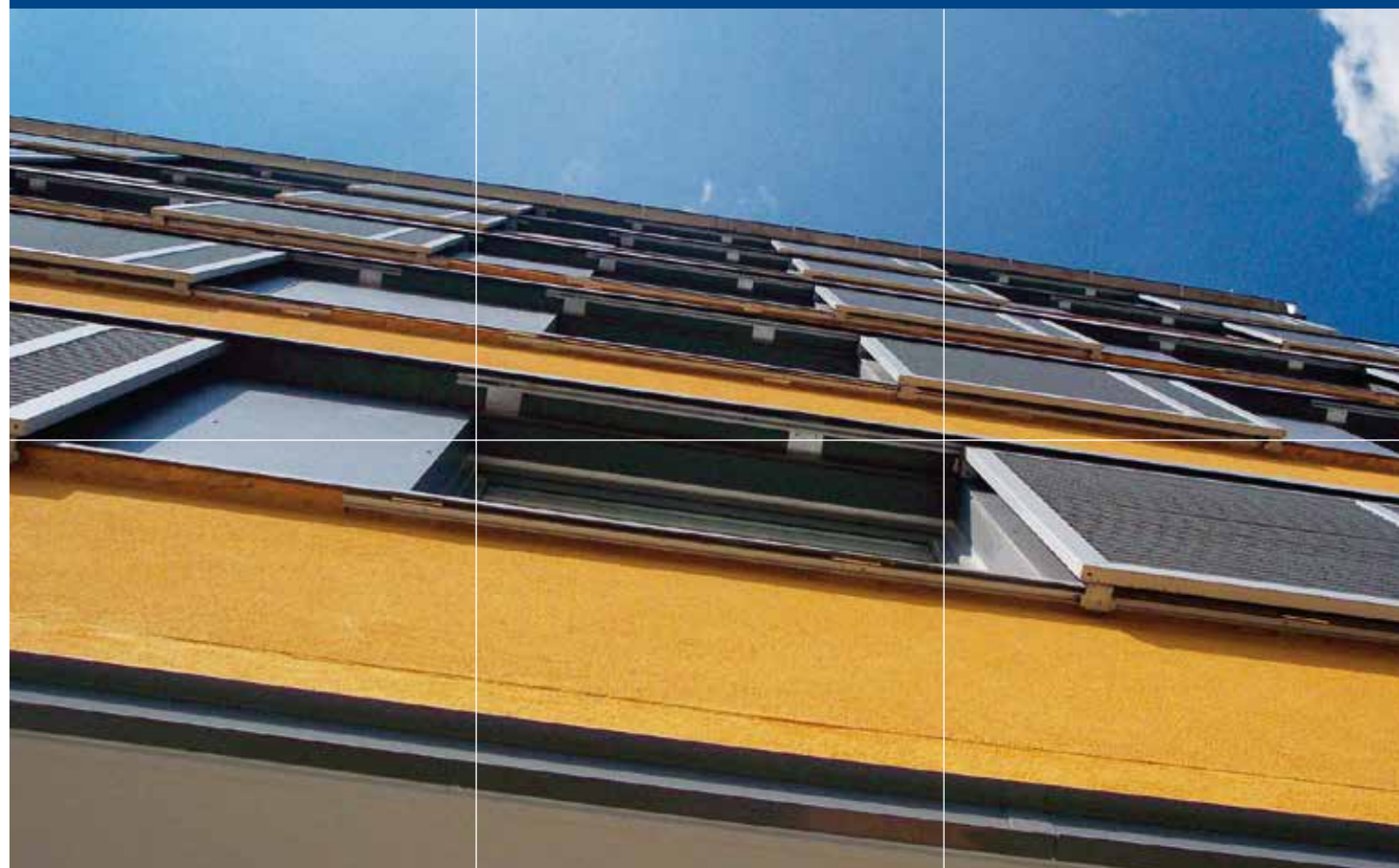
Automatische Faltläden aus Holz. Design und Funktion – hier Photovoltaik.

Baier bewegt. Nicht nur Ihre Fassade – Just-in-Time