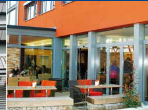
Weitläufige Bistro-Fassade in Kombination mit Holz und Stein.