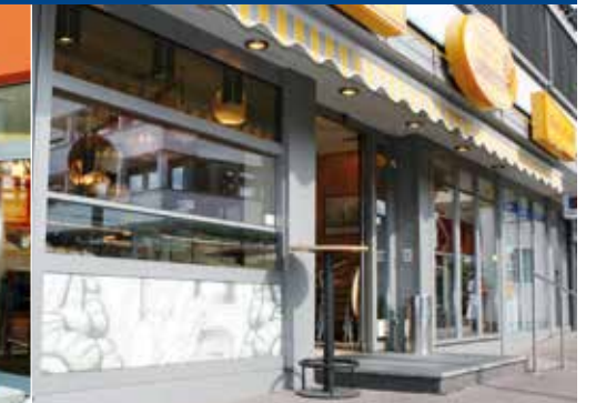
Aus einem Guss: Automatiktüren und Schiebefenster für den Straßenverkauf.